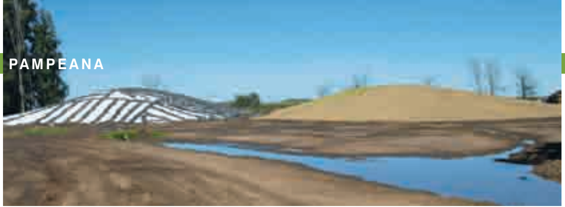
El silo es una pieza clave en el planteo de los Courreges, gran responsable del logro de una ración barata.

haremos grano húmedo y se lo destinará al feedlot. Sobre esta cebada se implantará el maíz para silo. Además, al recibir animales tan chicos es vital tener un muy buen alimento de arranque, y en eso el silo de cebada es mucho más palatable, muy parecido al pasto”.