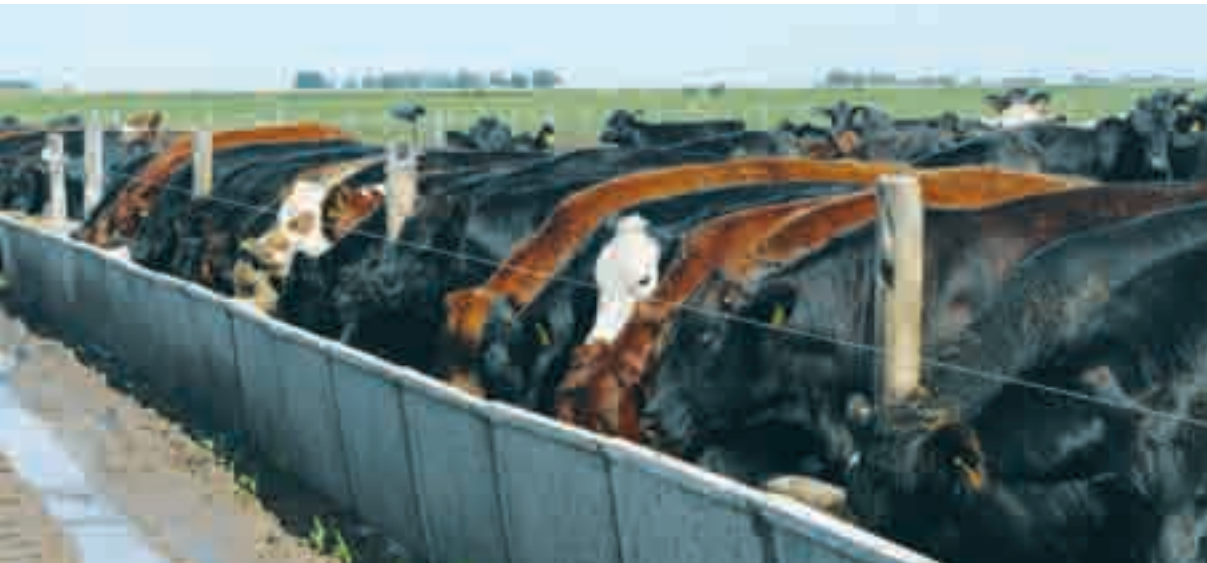
La etapa de engorde propiamente dicha dura 60 días. El animal sale con 300 kg, apuntando al mejor precio de mercado.

desde los 100-120 kg hasta los 320 kg, a partir de internada de compra”, aporta Bernard.