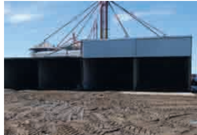
Galpón de alimentos estratégicamente ubicado respecto de los corrales.

Vaya que así fue. Los Courreges han generado todo un mercado, debido a que ya es vox populi que están comprando este tipo de maíces. Los números cierran porque calculan el costo de la materia seca, descuentan el flete y después ne-