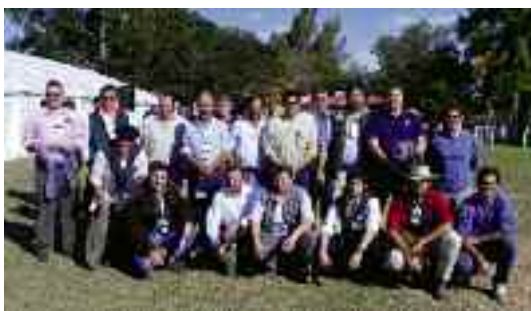
El equipo de técnicos de la EEA INTA Mercedes, vitales en el éxito de este día de campo.

Otra jornada del IPCVA con una magnífica respuesta del público, coherente con la seriedad de la propuesta.