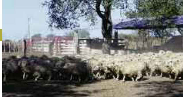
Los lanares se complementan con el bovino y hacen un generoso aporte a la facturación de La Esperanza.