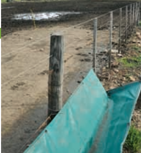
Comederos de lona en el corral. Se privilegian las estructuras de bajo costo.

La clave sigue siendo no superponer en el campo camadas de invernada con el próximo destete , si bien en el fondo es una preocupación orientada sobre todo a la vuelta de los novillos