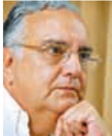
Por Gonzalo Álvarez Maldonado Presidente del IPCVA

El cambio de figuras públicas, más aún cuando se trata de personas de gran conocimiento de la