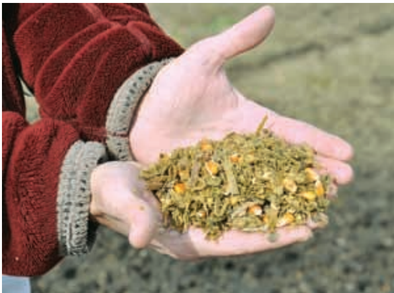
La incorporación de picado de maíz de planta entera acomodó los costos.