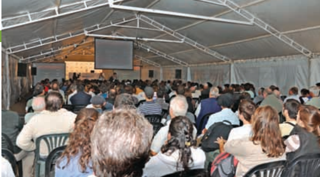
Magnífica respuesta de productores, técnicos y estudiantes a la convocatoria del IPCVA.

lizados bajo el mismo nombre sólo por tener la nervadura marrón”.