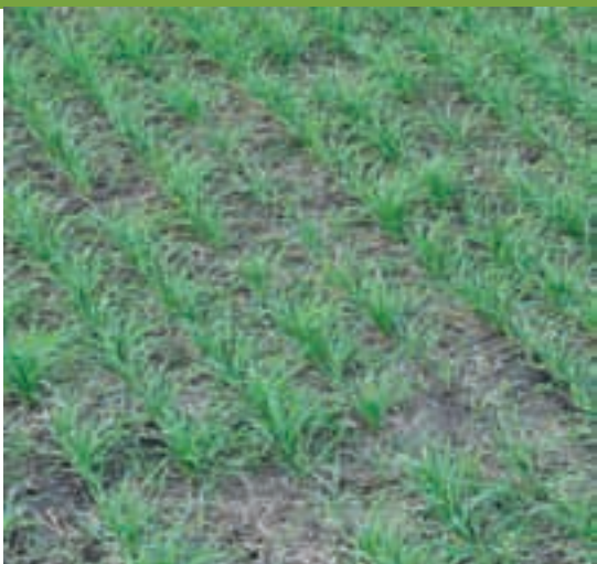
El verdeo (trigo) es clave en la etapa de recría y engorde, alternando con el corral.