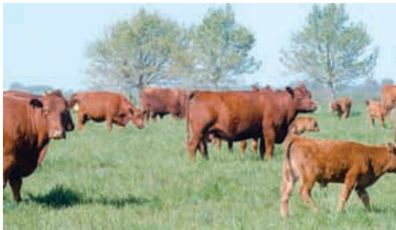
El animal ingiere el parásito al consumir pasto, y éste desde el intestino llega al hígado.

Según Dimattia, el control de esta enfermedad se vincula con la categoría de la hacienda :