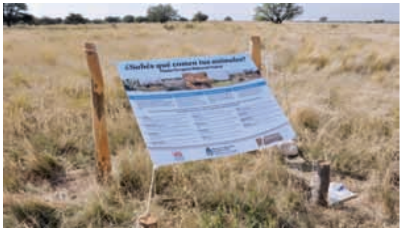
Se hizo hincapié en la diferenciación de las especies que componen el pastizal natural, a los efectos de potenciarlas.