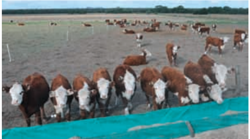
En cuanto al corral, la idea es recurrir a estructuras sencillas y lo menos fijas posible.

La vaca se alimenta del campo natural. En invierno si las cosas se complican se la apoya con rollos o silo de maíz picado en planta. La parición también se produce en campo natural; los rastros no se pastorean, Duvillard está convencido de que todo ese material orgánico juega a favor de la salud del suelo, y por eso entiende que es importante evitar el pisoteo. “¿Ajustes?