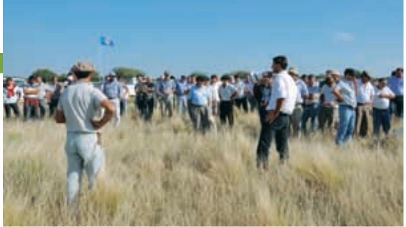
Un mundo de gente en una de las paradas de campo. Avidéz absoluta por escuchar los consejos de los especialistas.

La presencia del mijo perenne continuará en ascenso en este campo, ya que se va a realizar en él la cría de los toros durante la primavera y el verano; de esta forma se achican costos al evitar los verdes y se cuida más el suelo.