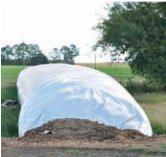
El silo de maíz picado en planta integra la dieta que se suministra en el corral.