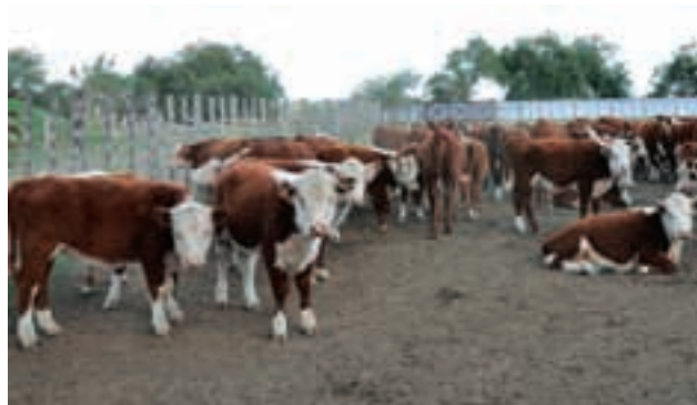
Sangre Hereford con más de 80 años en la zona. En Buen Abrigo se valora especialmente la pureza racial.

Hemos participado con nuestra ganadería en exposiciones de novillos y terneros gordos en Victoria, en las que por cierto hemos obtenido primeros premios . El mismo éxito logramos en las evaluaciones correspondientes al block test realizado en la planta de Swift en San Jose”. (Duvillard)