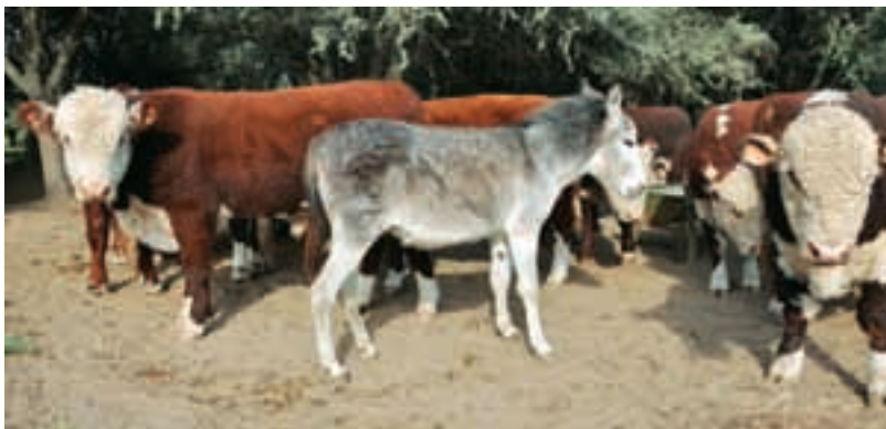
La burra trabaja para el bienestar animal del rodeo, que se manifiesta mucho más sereno con esta presencia.