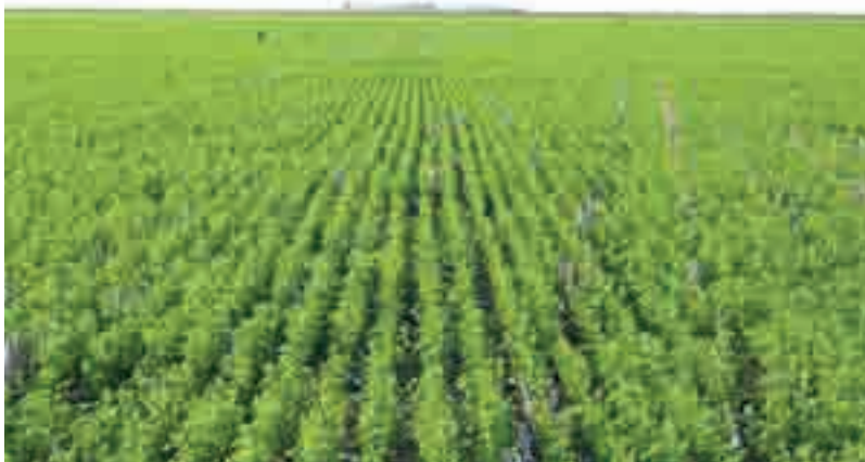
Alfalfa en implantación. Estos productores prefieren praderas puras y grupos de latencia 8 a 10.