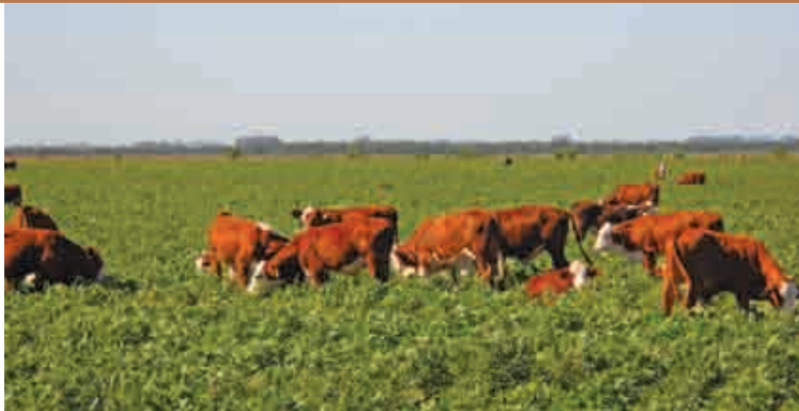
En El Rocío todo lo que no es arroz implica alimento directo para la hacienda, incluso la soja.