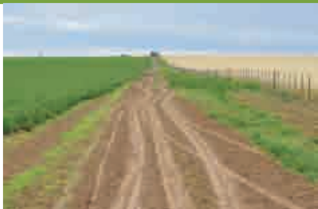
Un fresco del planteo de los Vitelli. A la izquierda un excelente lote de alfalfa, a la derecha un centeno.