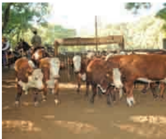
Las vaquillas son una garantía para cualquier rodeo. Genética de punta plenamente adaptada al NEA.