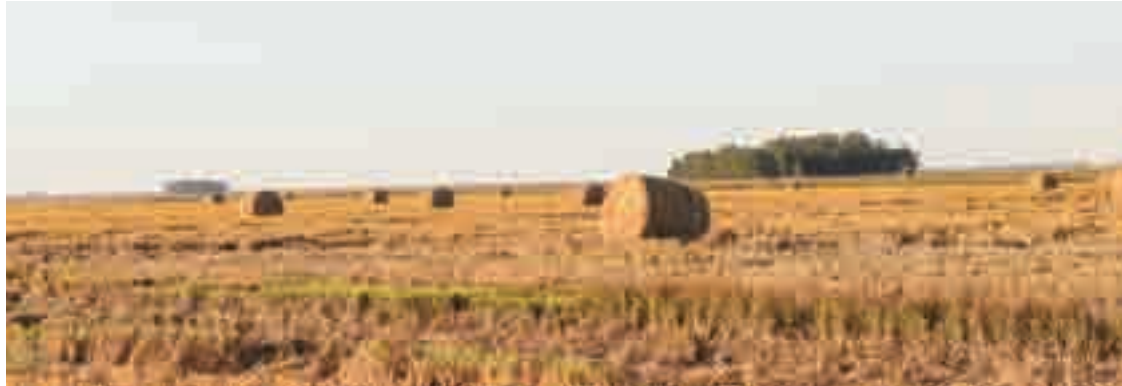
Confeccionar rollos a partir del rastrojo del arroz potencia la ganadería y resuelve el problema de su abundancia.