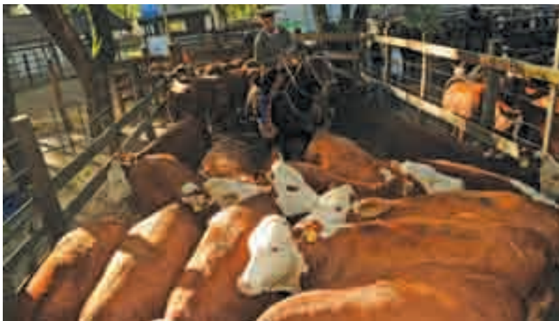
Remate de cabaña de elite, que involucra toros y vaquillonas preñadas.