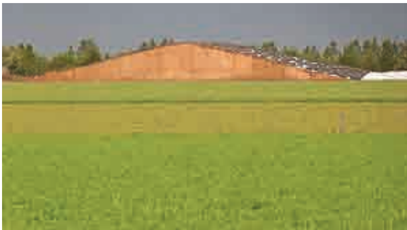
El silo de maíz entra con fuerza en el planteo. Importa especialmente el contenido de grano.

El número de novillos que se engordan cada año es variable según las contingencias del negocio, aunque la idea es manejarse en torno de los 4.800 animales. Las pasturas se ubican en áreas en que normalmente se hace agricultura, insertas en una rotación mixta. Son praderas de alfalfa que requieren suelos de buena calidad,