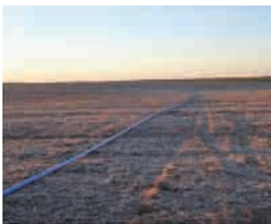
Vista del esquema de distribución del agua en las parcelas.